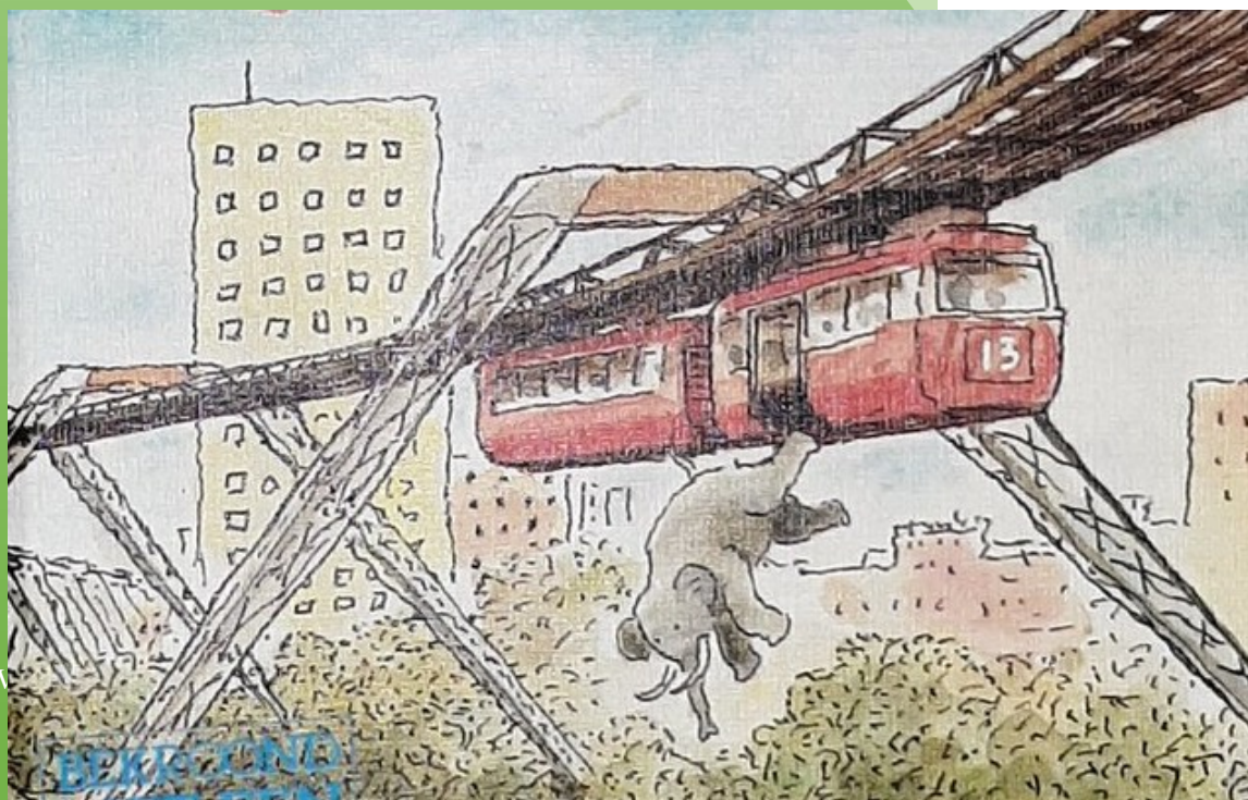
Een afbeelding uit het boek van Els Pelgrom - "Het onbegonnen feest"