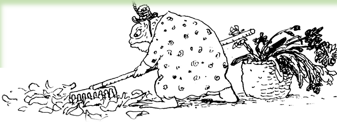
Abbeelding van Ma PAD uit het Kinderboek "Het onbegonnen feest" van Els Pelgrom

Draag eraan bij dat we nieuwe producties kunnen maken en wordt lid van Vrienden van 'O'