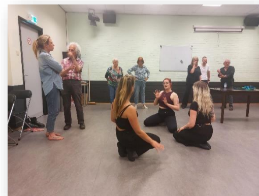
Oefenen voor de verleidingsscene

De vrouw vertelt haar man over een dagdroom die ze heeft gehad toen ze op vakantie een mooie Deen zag. Licht in de war gebracht door de verhalen van zijn vrouw dwaalt de man rond in nachtelijk Wenen en belandt op een geheimzinnig seksfeest buiten de stad. Als hij thuiskomt, hoort hij zijn vrouw uitzinnig lachen. Ze vertelt haar nachtmerrie, vol seks en geweld. Dromen (van de vrouw) en werkelijke odyssee (van de man) gaan in het boek samen op. Gelouterd zijn op het einde man en vrouw.