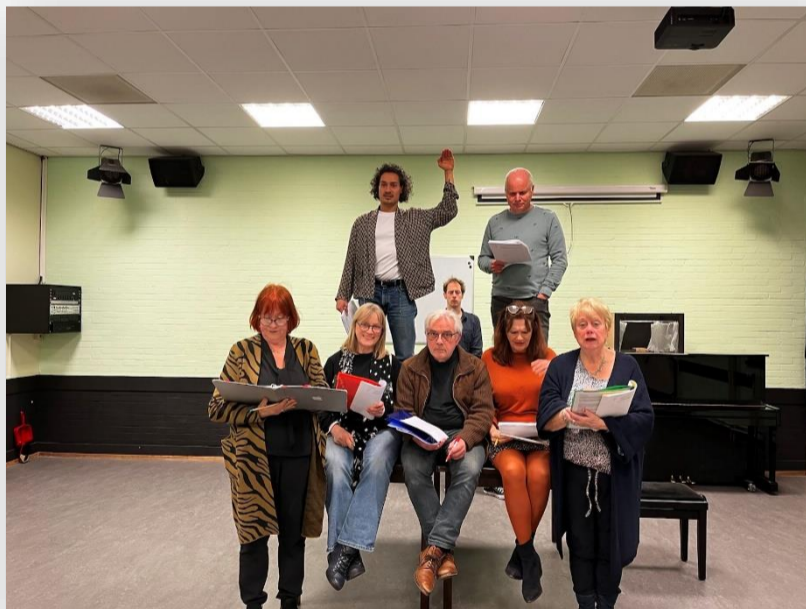
Piramide om de dokter aan te kleden voor het bal

Bijna 100 jaar geleden schreef de Weense arts Arthur Schnitzler Traumnovelle, over hoe mensen kunnen omgaan met seksuele fantasieën en de daarbij gepaard gaande verdringing en onderdrukking.