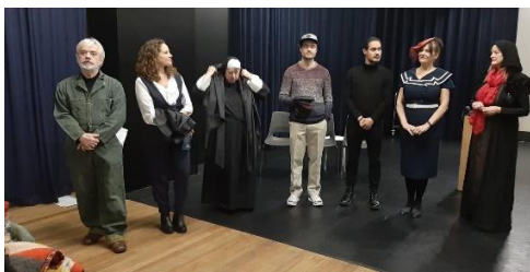
De laatste repetitiebijeenkomst op 8 maart in het Polanen, vlak voor de generale repetitie.

Het is knap wennen. Repeteren via de computer of mobieltje. Muziek maken met z'n allen is een nog grotere uitdaging. Toch is het een uitkomst om de contacten binnen de club wat te kunnen onderhouden. De grootste uitdaging is om iedereen aan het woord te kunnen laten zonder elkaar in de wielen te rijden en te interumperen. Eigenlijk het tegengestelde van het debat Trump – Biden van enkele dagen geleden. En het gaat ons steeds beter af. Het synchroon zingen blijft knap lastig maar het doornemen van teksten en op elkaar reageren gaat eigenlijk bijzonder goed. Zelfs vergaderen – de afgelopen ledenvergadering was daar een goed voorbeeld van – lukt heel erg goed. We gaan ons met deze middelen voorbereiden op beter tijden