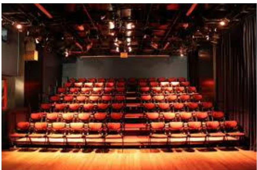
Het prachtige exterieur en interieur van ons vertrouwde theater