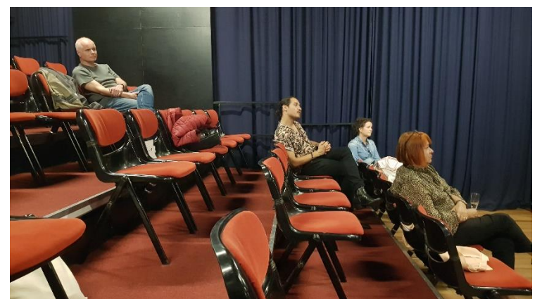
1,5 meter ook in de theaterzaal

Nadat het Polanentheater (voorlopig) weer was gered via een actie. Hoorden we van hen dat de maximale speelmogelijkheden waren om met maximaal 5 mensen tegelijk op het podium te laten spelen en met maximaal 25 mensen in de zaal als publiek toe te laten.