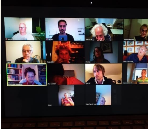
Bijeenkomen via Zoom