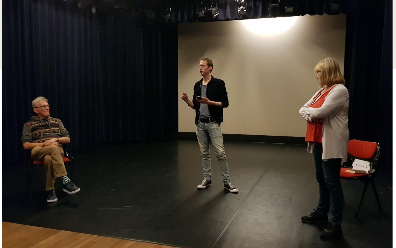
Eerste bijeenkomst op 1,5 meter in de theaterzaal van het Polanen op 10 september 2020