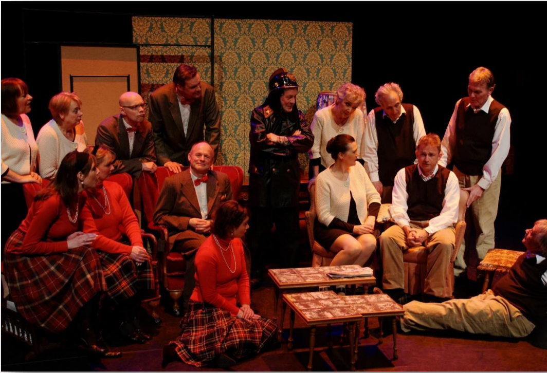
De Kale zangeres met de brandweerman uit 2009

En dat maakt de voorbereiding enorm speciaal. Repeteren op afstand in je eigen kamer en via de video samenspelen met alle spelers. Het heeft zo z'n beperkingen maar wel heel interessant om te ervaren wat er op afstand toch allemaal mogelijk is