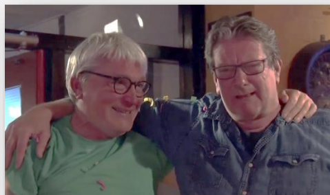
Emoties in het Polanen tijdens de "Red het Polanen" uitzending in mei 2020

De acties voor Polanen duren tot 28 maart met een Facebook uitzending over het behaalde resultaat.